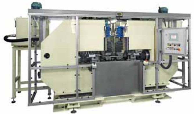
ABOCARDADO DE TUBOS TUBE END FORMING ENTROHRBEARBEITUNG

In unserer Entwicklungsabteilung entwickeln wir kundenspezifische Lösungen mit Hilfe der aktuellsten Technologie, die der Kunde erwartet und den innovativsten Produkten die der Markt bietet.