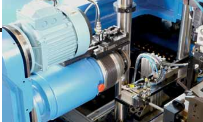
REMACHADO / RIVETING / NIETEN

CONTROL AND TESTING TECHNOLOGY. These technologies are normally used for the parts presence detection, dimension control, checking of parameters like temperature, flow, pressure, sealing and leaking test. They are also used in fatigue and durability functional testing.