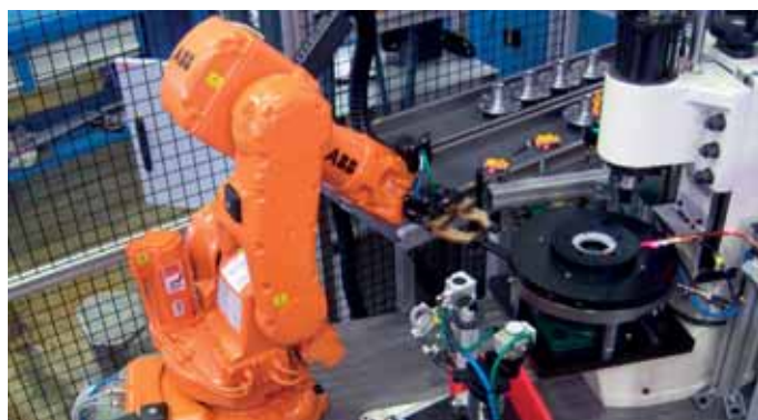
MANIPULACIÓN / HANDLING / BEARBEITUNG