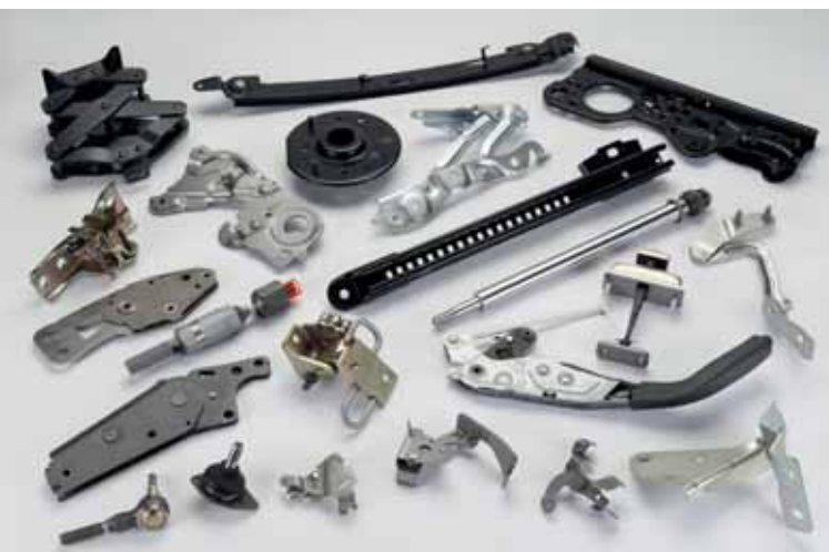
AUTOMOCIÓN / AUTOMOTIVE / AUTOMOTIVE