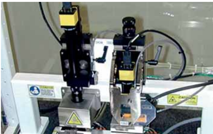
VISIÓN ARTIFICIAL / ARTIFICIAL VISION / VISUALISIERUNG