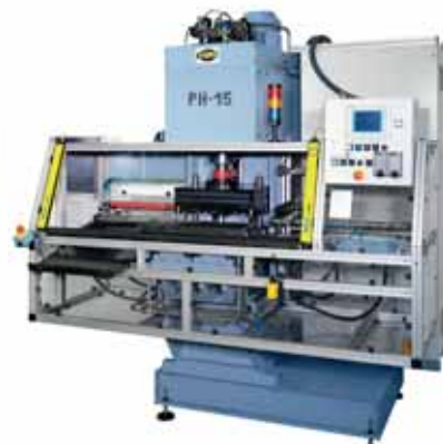
PRENSADO / PRESSING / PRESSEN