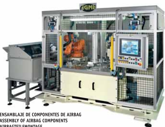
ENSAMBLAJE DE COMPONENTES DE AIRBAG ASSEMBLY OF AIRBAG COMPONENTS AIRBAGTEILEMONTAGE