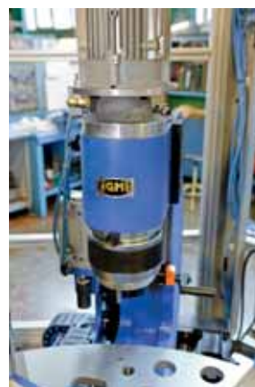
REMACHADO / RIVETING / NIETEN