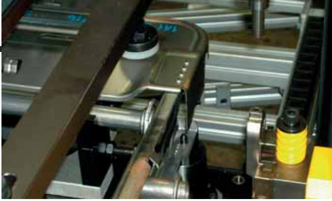
CLINCHADO / CLINCHING / BÖRDELN