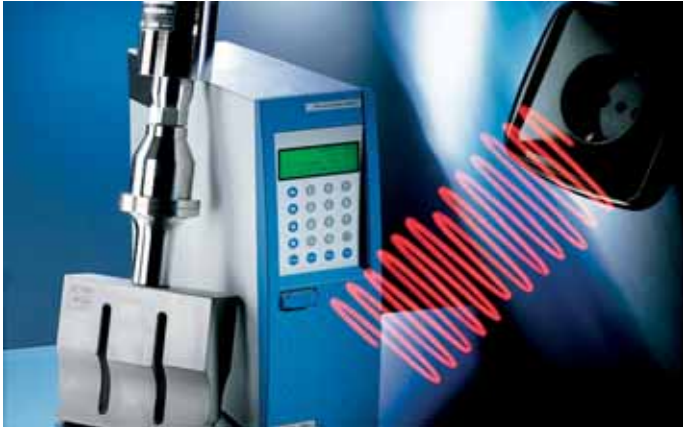
ULTRASONIDOS / ULTRASONIC / ULTRASCHALLSCHWEIßEN