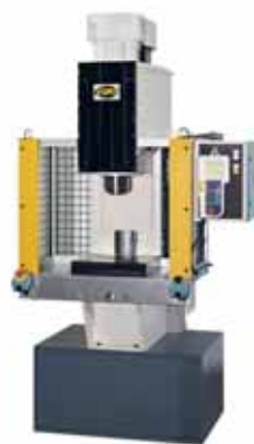
PRENSAS ELÉCTRICAS / ELECTRIC PRESS / ELEKTRISCHE