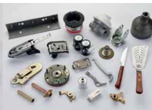
VIARIOS / VARIOUS / VERSCHIEDENE