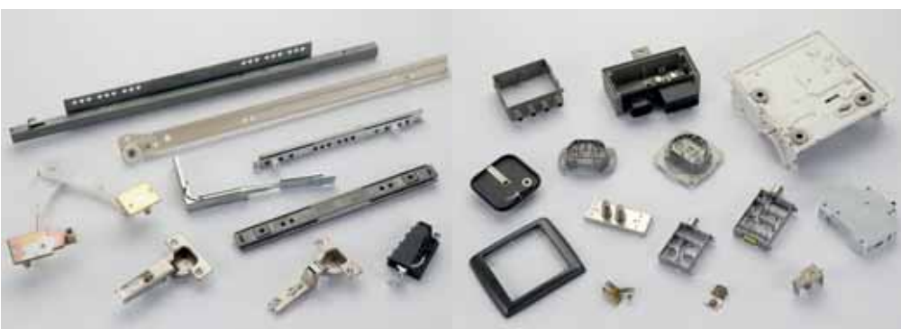
LÍNEA BLANCA / HOUSEHOLD APPLIANCES / HAUSHALT APARELLAJE ELÉCTRICO / ELECTRICAL APPLIANCES / ELEKTRIK

Verschiedene: Industriebürsten, Springfederverbindungen, Bratenheber, Scheren, Verbindungen, Kufen, Leitersprossen, Gasregulatoren und Haken, u.a.