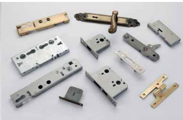
CERRAJERÍA / LOCKSMITH / SCHLÖSSER