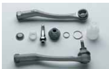
ENSAMBLAJE DE RÓTULAS ASSEMBLY OF BALL JOINTS KUGELGELENKMONTAGE

Dank des Einsatzes dieser Prozesse in eine Anlage und der Zusammenarbeit mit den Kontrollsystemen werden menschliche Fehler ausgeschlossen und ein kontinuierliche Ablauf der automatischen Produktion ist gesichert. Als Ergebnis erhält man einen Produktivitäts- und Wettbewerbsvorteil, als auch eine beachtliche Zeitersparnis.