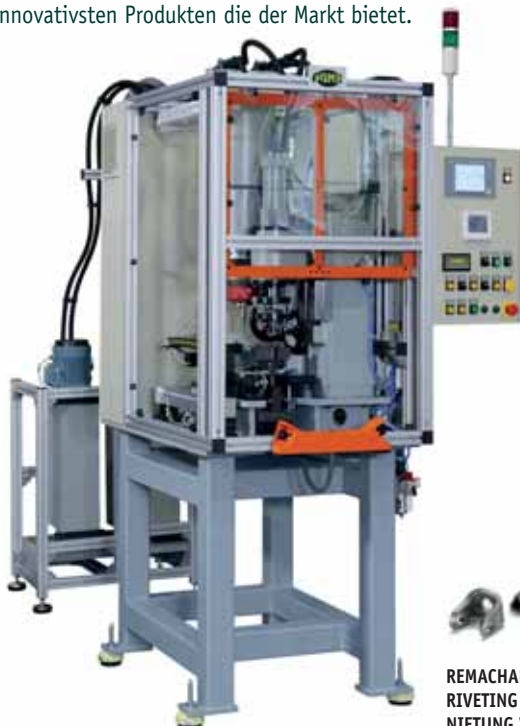
REMACHADO DE BARRA TRIANGULAR RIVETING OF TRIANGULAR RODS NIETUNG VON DREIECKGESTÄNGEN