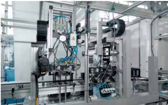
ENGRASADO / GREASING / SCHMIERUNG