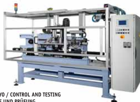
TEST Y ENSAYO / CONTROL AND TESTING / KONTROLLE UND PRÜFUNG