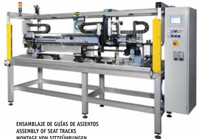
ENSAMBLAJE DE GUÍAS DE ASIENTOS ASSEMBLY OF SEAT TRACKS MONTAGE VON SITZFÜHRUNGEN